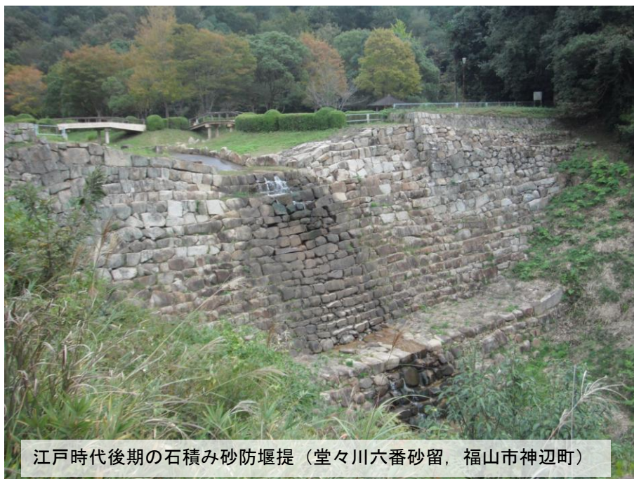
江戸時代後期の石積み砂防堰堤（堂々川六番砂留，福山市神辺町）