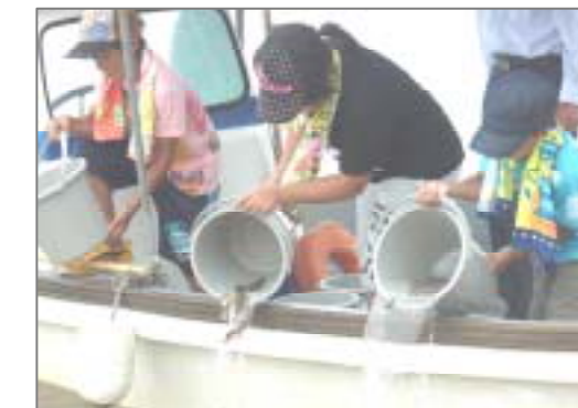
ちぎよ たい ほうりゅう ようす 稚魚(鯛)の放流の様子

鞆港から走島に渡り、まずは走島公民館でシラスごはんやタコ飯、ところてんなど、地元で獲れた食材を使ったおいしいお昼ごはんをいただきました。お腹いっぱいになったところで、史跡めぐりへ。地元の方の案内で、村上神社・庄屋跡などを訪ね、走島の歴史を学びました。その後、走島の名産であるちりめんの工場を見学。工場で作られた、できたてのシラスの釜揚げもいただきました。そして、海岸に到着すると、走島小・中学校の生徒のみなさんと合流し、まずは稚魚の放流を体験しました。そのあと、海辺の環境調査を実施しました。この調査で、きれいな海にしか生息しない生き物がたくさん見つかり、走島の海がとてもきれいな海だということを確認できました。そして最後に、全員で浜辺の清掃活動をし、鞆港に帰ってきました。強い太陽が照りつける中の探検ツアーでしたが、参加された方からは「次回も参加したい」との声も聞かれ、とても楽しいツアーとなりました。