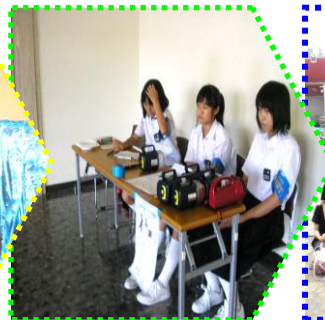
絵本おばけやしき実施