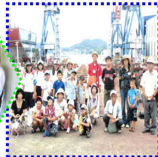
常石造船探検ツアー