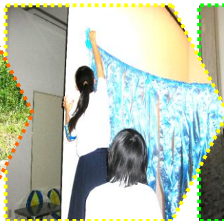
絵本おばけやしき仕上げ