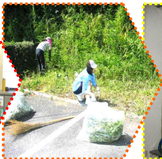
図書館で剪定作業