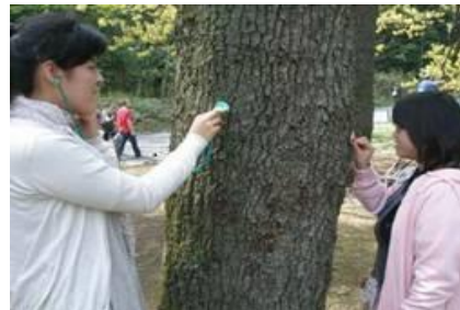
聴診器で木から聞こえてくる音を聞く