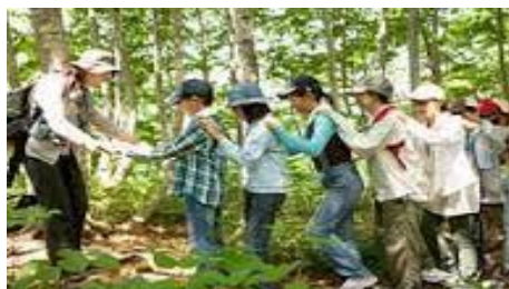
目隠しをして誘導されながら自然散策