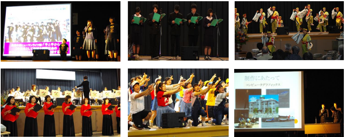
写真は、2016ふくやま 人権・平和フェスタの様子