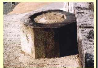
「砲弾が取り除かれ台座だけ残る凱旋記念碑」

内容：戦争の体験や記憶を風化させることなく次世代に伝えるため、福山市内に今なお大きな傷跡を残している戦争遺跡を巡り、「平和の尊さ」と「いのちの大切さ」について考えるパネル展示です。