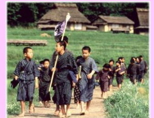
映画「橋のない川」スチール写真

内容：奈良盆地の農村の「小森部落」を舞台に、被差別部落に生まれたがゆえにいわれなき差別を受けながらも、のがれようのない差別からの解放に向けた闘いと、不条理を打破するために立ち上がっていく物語をパネルにて紹介します。