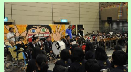
2017ふくやま人権・平和フェスタの様子

問合せ：福山市人権交流センター NPO 法人ゆにばーさる TEL084-951-5700