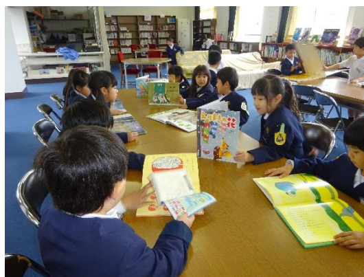
学校図書館の様子