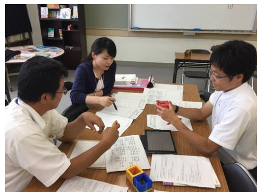
専門性を高める一斉研修の様子