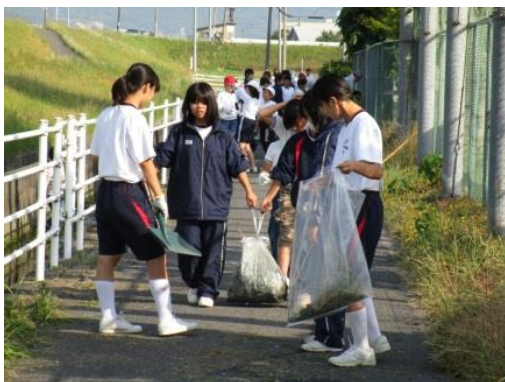
小中合同清掃作業