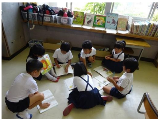
小学校「学びづくりフロンティア校」事業 (音読劇の練習の様子)