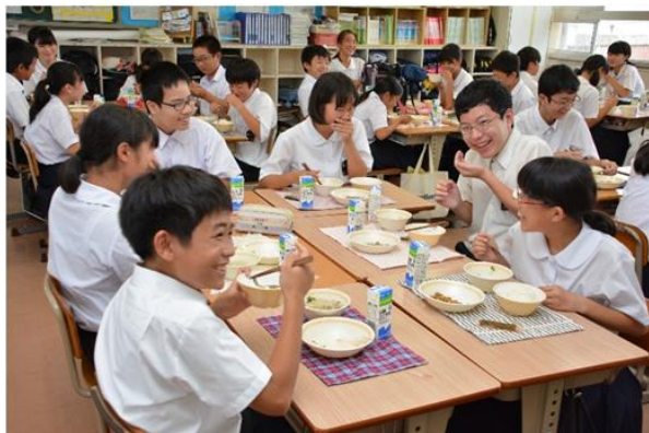
中学校給食の様子