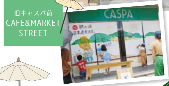
旧キャスパ前 CAFE&MARKET STREET