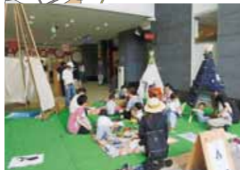
親子で楽しめるワクワクCAMP