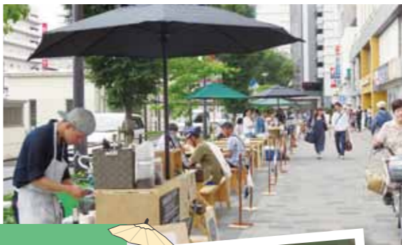
椅子やテーブル、バンヨリが設置された歩道