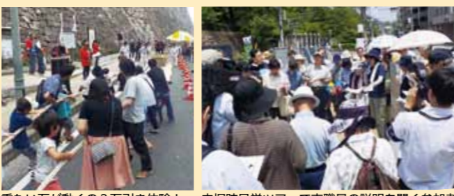
重たい石が動くの?石引き体験! 内堀跡見学ツアーで市職員の説明を聞く参加者