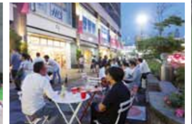
開放的なスペースでくつろぐ人たち