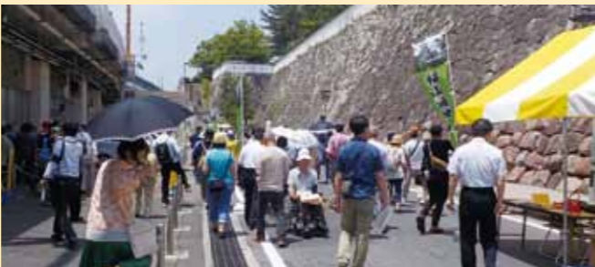
歩行者天国となった福山城南側道路