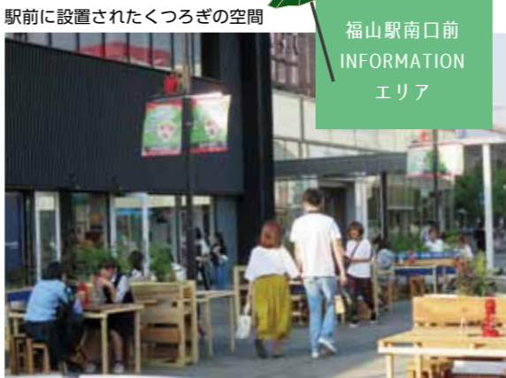
駅前に設置されたくつろぎの空間

実行委員会では、今回の結果を検証し、皆さまに駅前再生の息吹を実感していただけるような魅力的なコンテンツの検討などを行いながら、次回開催につなげていきます。