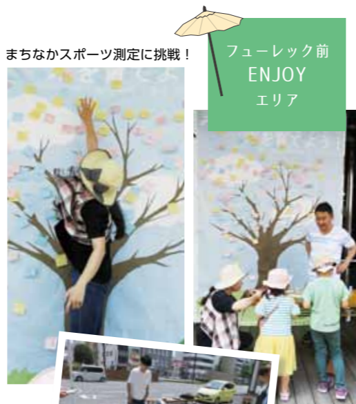
まちなかスポーツ測定に挑戦!