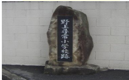
⑮ 野上尋常小学校跡