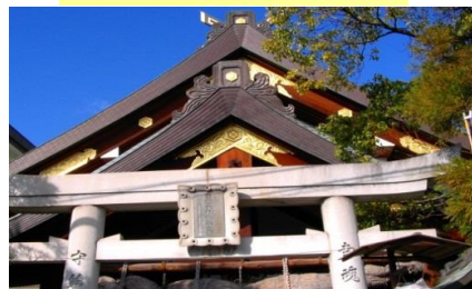
⑭ 出雲大社福山分詞