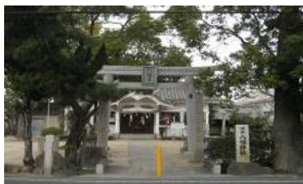
④川口八幡神社 300年余の歴史あり