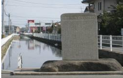
②多治米沖川改修記念碑