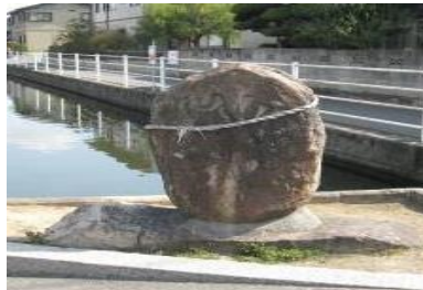
③多治米中 地神さん