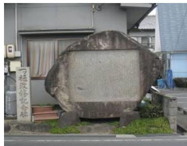
⑥一ツ樋改修記念碑