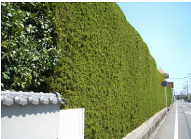
④福山市指定保護樹林 カイズカイブキ