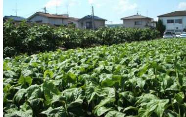
②くawaii畑（福山特産・日本一） いちじく畑