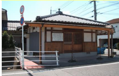
⑤お月さん・石像の本尊 「月山大権現」が祀られています。