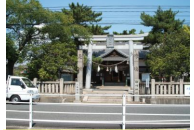
③塩崎神社・八幡神社