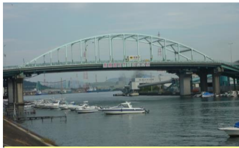
②【入江大橋】 毎日多くの人が通っています