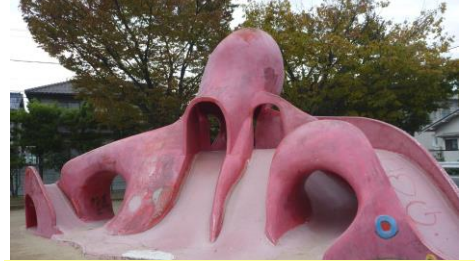
⑥【手城中公園】 手城のシンボル「タコさん」です