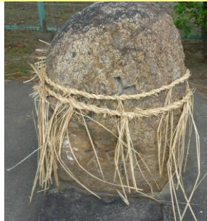
⑤【地神さん こんぴらさん】 (手城中公園の外) 作物がたくさん取れるようにとの願いがこもっています