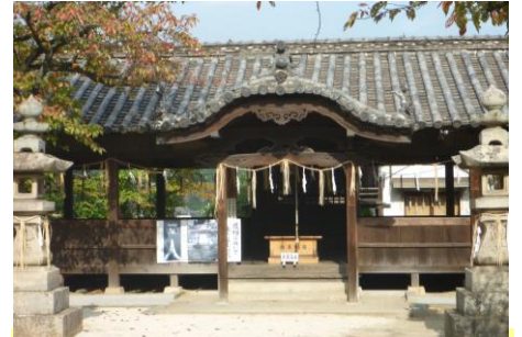
③【天当神社】田畑の守護神 五穀豊穡が祈願されています