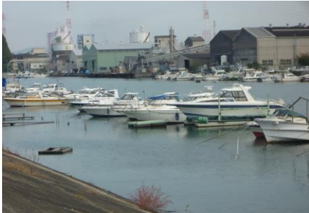
①【停留 船】 土日には多くの釣り人が来ます