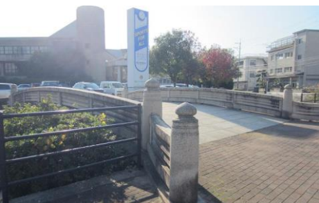
⑥石橋を渡って体育館へ