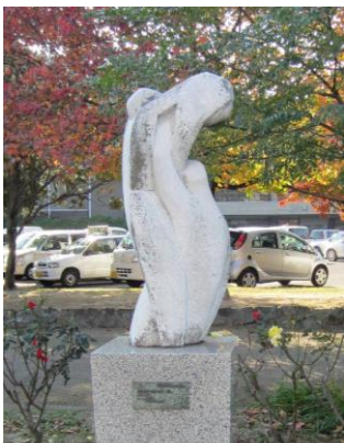
④ “バスケットボール”