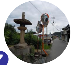
7 石塔が右折の目印