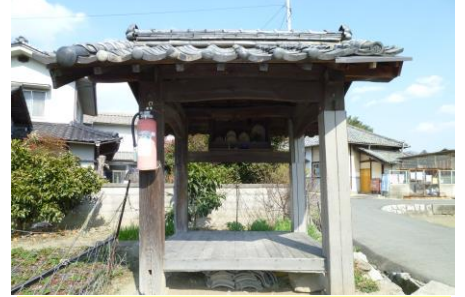
⑥ 休み堂（オ戸） 昔は旅人も休んでいたのかな？