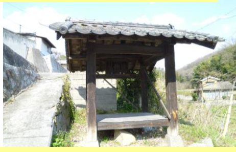
⑤ 休み堂（オ戸） 歩いていると右手に見えてきます