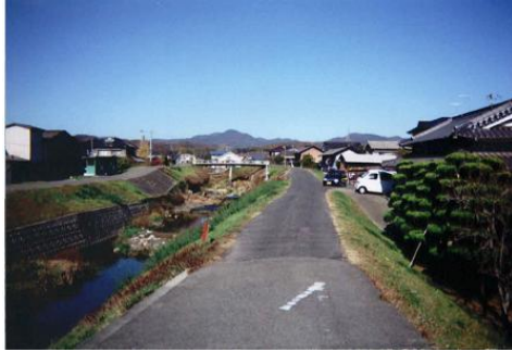
⑧この辺りから、眺める四季 折々の蛇円山、絶景です！