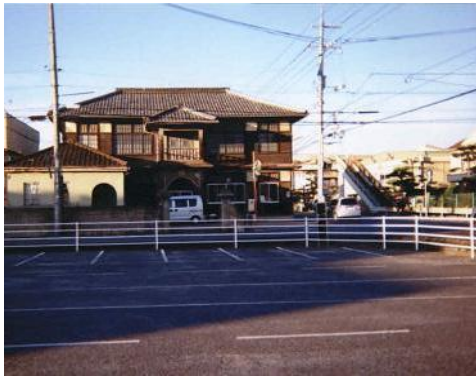
⑩旧駅家町役場庁舎です 現在も地域の集まりなどに使用さ れています