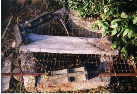
②中山績園先生家跡です 五角形の井戸は珍しいと思います