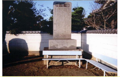
⑨倉光に「優則学舎」を開き、郷土の 青少年の育成に貢献した功績をたたえ た碑