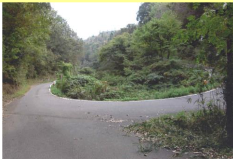
⑤右に進みます 森林浴をお楽しみください