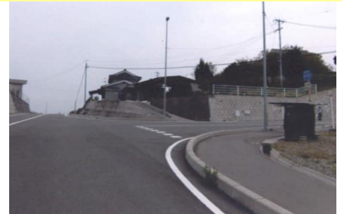
⑥右に進みます。上り坂ですので、 自分のペースで歩きましょう