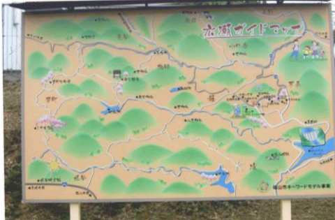
②広瀬全域の案内板があります。 ご利用ください