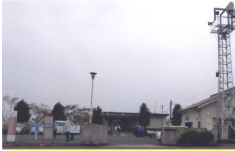
①広瀬公民館を出発します 春には桜満開で綺麗です