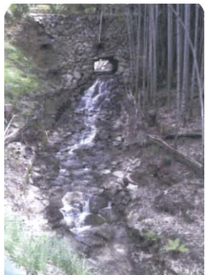
①金名の郷頭 江戸時代に造られた堰と橋の機能を兼ね備えた石造構築物