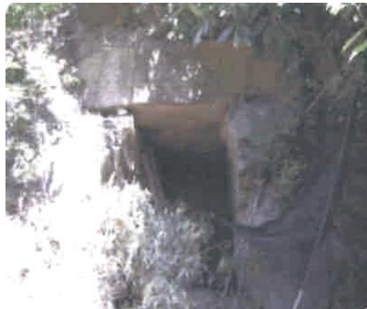
②13基ある権現古墳群の、第1号古墳の横穴式石室