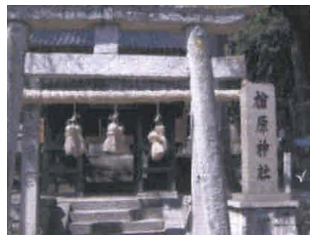
③金名の榎原神社（トイレ有）