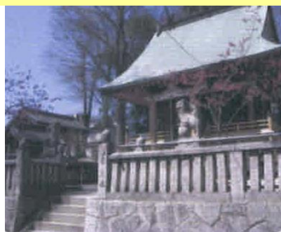
④浅原の品治別神社（トイレ有）