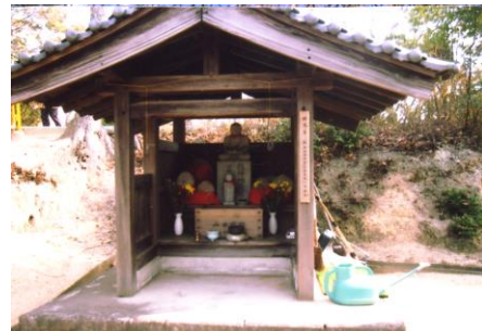
④銭神社：近くに銭神古墳があります