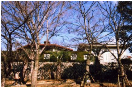
③老人福祉センター：目前に美しい春日池がある高齢者の集いの場