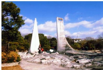
②春日池：園内は四季折々の美しい花が咲き市民の憩いの場となっています