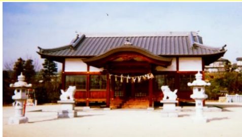
⑤天神社：祭神は菅原道真公