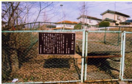
⑥大蔭古墳：春日の歴史を感じます