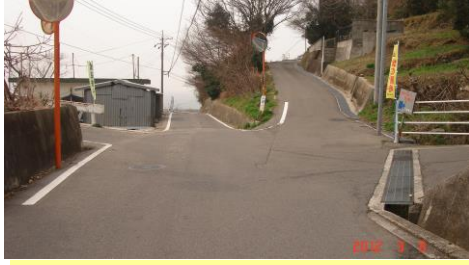
①団地の下の五叉路を越えると海