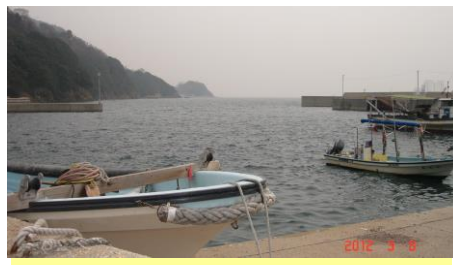
②小用地の漁港に出ます。