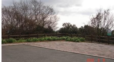
⑤長坂展望台。 眼下に見下ろす海の景色は最高!