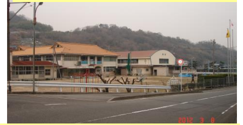
⑥内浦小学校まで帰ってきました。