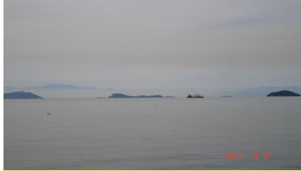
④天気の良いときは四国まで みえます。