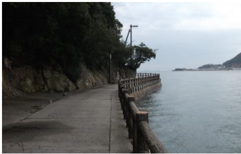
④阿伏兔観音までの道