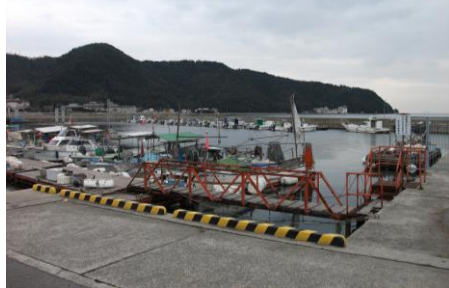
②公民館前の波止場