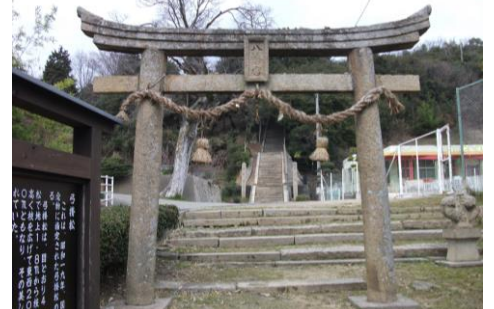
⑥能登原保育所隣の八幡神社