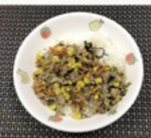
今年のメニュー(予定)の「たこ飯」(左)と「ひろしまオールスター★担々丼」(右)