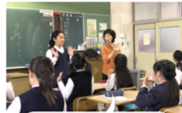
あいさつが手話でできるようになりました。日常生活の中で手話を使ってコミュニケーションの輪を広げたいです。

ありがとうございます 本市では2017年12月、手話のことを知り、互いに支え合って、誰もが安心して暮らすことができるまちづくりをめざして「福山市」をつなぐ手話言語条例」を制定しました。 教育委員会では条例を児童生徒に周知するために、NPO福山ろうあ協会と連携し、副読本「大好き！福山〜ふるさと学習〜」に条例の説明やあいさつなどのイラストを掲載しました。