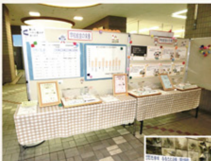
学校給食の目標や栄養などの紹介