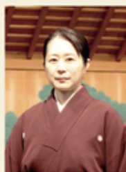
喜多流大島能楽堂 喜多流能楽師 (福山城築城400年記念事業実行委員会委員)

2022年の福山城築城400年に向け、福山城ゆかりの史跡を舞台に能の謡曲や舞、さまざまな音楽を披露する「福山名所コンサート」。第4回は水野勝成との関わりも深い吉備津神社で行います。このような地で伝統芸能を披露するからこそ、伝えられる歴史の奥深さや魅力があります。能をはじめ、吉備津神社禰宜による講演や胡弓・三味線の演奏などを通じ、現代を生きる皆さんが少しでも福山の歴史に興味をもつきっかけになればと思います。