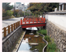
福山八幡宮前の旧水道跡

城下町建設と同時に、上水道網(福山旧水道)を整備。また、城下町を氾濫から守るため、芦田川の治水・灌漑・利水事業も行った。