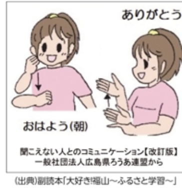
聞こえない人とのコミュニケーション【改訂版】 一般社団法人広島県ろうあ連盟から (出典)副読本【大好き福山〜ふるさと学習〜】

ありがとうございます 本市では2017年12月、手話のことを知り、互いに支え合って、誰もが安心して暮らすことができるまちづくりをめざして「福山市」をつなぐ手話言語条例」を制定しました。 教育委員会では条例を児童生徒に周知するために、NPO福山ろうあ協会と連携し、副読本「大好き！福山〜ふるさと学習〜」に条例の説明やあいさつなどのイラストを掲載しました。