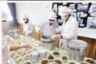
近隣の小学校給食室や給食センターで調理した給食を給食士や栄養士が配膳