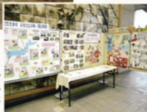
食育クイズや夏休み子ども料理教室の様子、ひろしま給食100万食プロジェクトなどの紹介