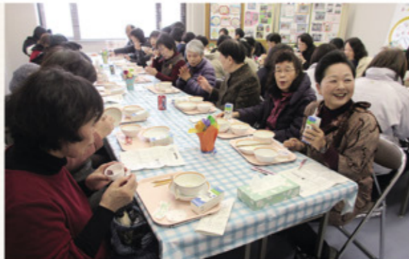
学校の給食と同じように、みんなそろって「いただきます」をして食べました。「おいしかった」「懐かしかった」などの声がありました