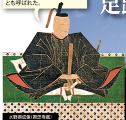
水野勝成像(賢忠寺蔵)

生没 1564～1651(永禄7～慶安4)年。三河国(愛知県)刈谷の領主・水野忠重の長男で、徳川家康のいとこ。織田家、豊臣家、徳川家に仕える。小牧・長久手の戦い、大坂の陣などで数々の武功を挙げ、「鬼日向」とも呼ばれた。