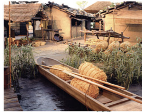
再現された草戸千軒の町並み(県立歴史博物館)