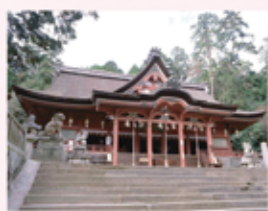
勝成が社殿を造営した吉備津神社

備後国一宮の吉備津神社など、備後国内の寺社を復興。旧領の刈谷や大和郡山からも寺社を移転させた。勝成は没後、水野神社(内海町)、聰敏神社(北吉津町)に御祭神として祀られている。