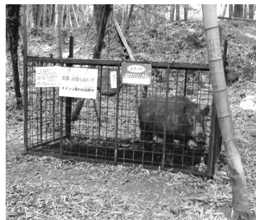
箱わなにかかったイノシシ