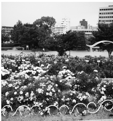
緑町公園ばら花壇

答 2009年5月、「100万本のばら市民会議」を立ち上げ、活発な議論で出された意見を集約する中で、「ばらのアクションプラン」の素案を取りまとめた。協働の視点を基底に検討しており、今年度中に同プランを策定したい。ばらオーナーは、現在3286人で次期会員募集を始めた。今後、ばらオーナー会と連携を図りながら募集を行い、より多くの皆さまに親しまれるばら花壇となるよう努めていく。