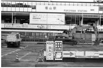
整備が進む福山駅前

問 政府の行政刷新会議による事業仕分けで、福山駅前整備事業が、まちづくり交付金の無駄遣いとされたようである。本事業は既に約8割が交付決定され、残りは2億2千万円余である。財源不足が生じた場合の手立ては。