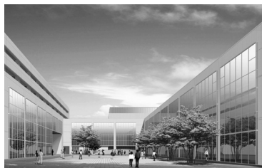
市立四年制大学完成イメージ図

れるための体制づくりなど、今後の取り組みは。また、住民参加型市場公募債の周知方法は。