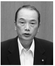
高木 武志 議員 日本共産党