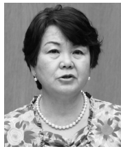
村井 明美 議員 日本共産党

①鳥取県や東京都では定期報告を行っていない施設の公表や防火対象物違反の公表で効果を上げている。本市でも制度の創設を求める。 ②既存不適格建築物に対し、毅然とした指導を貫き、改善勧告