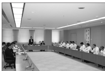
建築物査察等適正化対策委員会

な指導により一定の改善が行われている。 このような継続的な指導にも関わらず何ら対応がなされない場合は、行政の役割として、建築基準法や消防法にのっとった対応を厳格に行う必要がある。