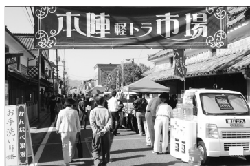
本陣市場 商工会が主体となったイベント (神辺町商工会)

テナントが入店する大型店等に対し、店内の小売業者の地域商工会への加入や、地域イベントへの参