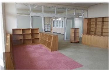
メディアセンター(図書館+パソコンルーム)

本やインターネットで調べ学習ができます。子どもたちの作品展示や、地域や床に座って読書ができるスペースもあります。保護者の方々の交流の場として活用します。