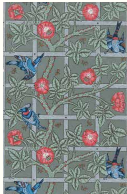
ウィリアム・モリス 《トレリス(格子垣)》 1863年(デザイン)・1864年(印刷) © Morris & Co.