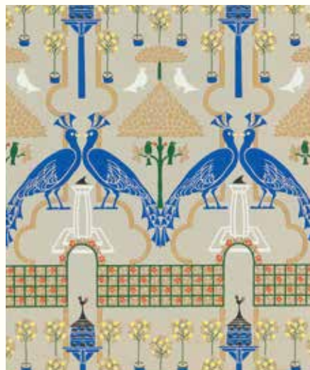
C・F・A・ヴォイジャー 《地主の庭》 1896年(デザイン)・1898年(印刷) © Sanderson