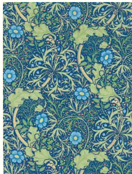
ジョン・ヘンリー・ダール 《シーウィード(海藻)》1901年(印刷) © Morris & Co.