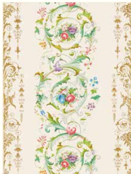
《花とロココ調スクロール》1850年頃 © Sanderson