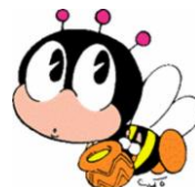
生涯学習のマスコット “マナビイ”