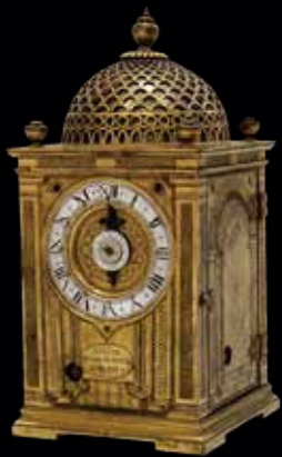
重要文化財《洋時計》徳川家康所用