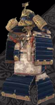
《紺糸威鎧》徳川吉宗所用

FUKUYAMA MUSEUM OF CALLIGRAPHY ふくやま書道美術館