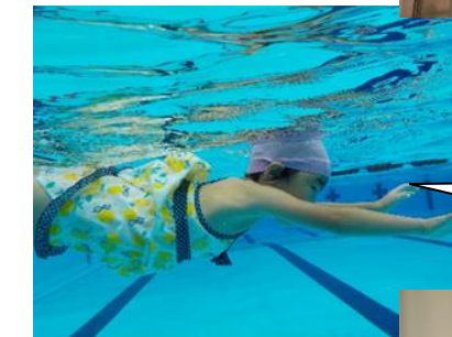
小学校でプール体験