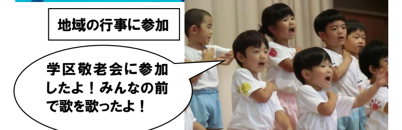
地域の行事に参加