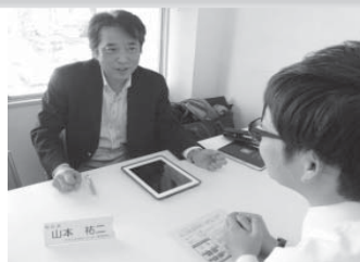
ボランティア・NPO等相談