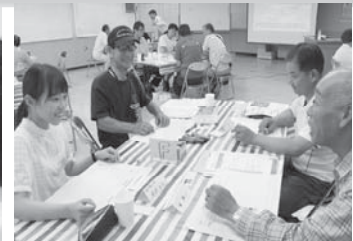
つながるまちカフェ