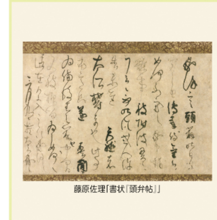
藤原佐理「書状(頭弁帖)」

近世文化展示室 特集展示「菅茶山と福山藩」 12/12(木)~2/2(日) 廉塾や著作を通して菅茶山と福山藩との関係について紹介 一般290円、大学生210円、高校生まで無料