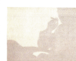
高松次郎「パイプをくわえた男」1970年

12/18(水)~4/5(日) 影による効果を活用した作品をジャンル別に展示 一般310円、高校生まで無料