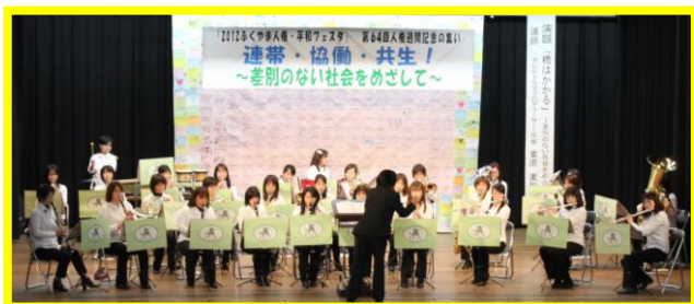
オープニング まま～ずプラスアンサンブル♪福山による演奏