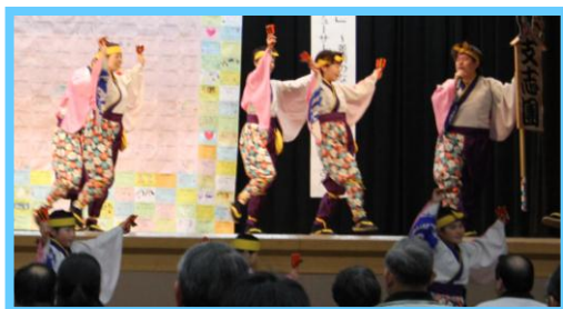
支志團による「よさこい鳴子踊り」

12月16日(日)人権交流センターにおいて、『2012ふくやま 人権・平和フェスタ「第64回人権週間記念の集い」連帯・協働・共生！～差別のない社会をめざして～』を実施しました。