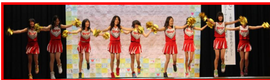
戸手高校ダンス部による「ヒップホップダンス」