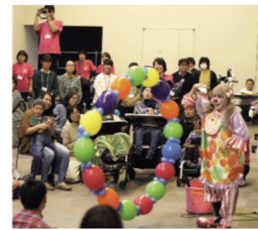
大道芸人によるパフォーマンス

本市では市民活動団体が企画・実施する活動を支援し、社会貢献活動の推進を図るため、始業期設立から4カ年度未満)の活動を対象とした福山市市民活動スタートアップ事業による補助制度を設けています。 この制度を活用して、今年度は5つの交付団体がそれぞれの団体や地域の特性を生かし、地域課題の解決や地域活性化、魅力創出につながる事業を実施しました。 皆さんも仲間とともに魅力あふれるまちづくりにチャレンジしてみませんか。 まちづくりサポートセンターではまちづくりに関する市民の交流拠点として、さまざまな支援を行っています。「市民活動スタートアップ事業」についても詳しく知りたい「NPO法人や市民活動団体を創設したい」「仲間と一緒にまちを元気にする活動がしたい」という人は、気軽にまちづくりサポートセンターへ問い合わせてください。