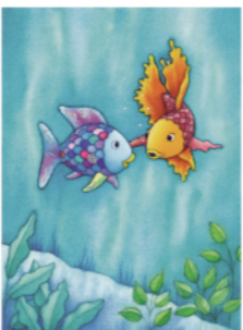
マーカス・フィスター「まけるのもだいじだよ にじいろのさかな」表紙原画2017年/©MK

ふくやま美術館 ☎932-2345(西町二丁目4番3号) わたしの習作展 時3/12(木)~15(日) 内長期実技講座《後期》受講生の作品展示(油彩画、水彩画、エッチング) ¥無料 ID173626 絹谷幸二の世界-富士山を中心に-関連行事 ■学芸員によるギャラリートーク 時3/8(日)14:00~ ※特別展観覧券が必要 ID173620 冬季所蔵品展「影の美術」関連行事 ■学芸員によるギャラリートーク 時3/14(土)15:00~15:30 ※所蔵品展観覧券が必要 ID173623 特別展示「小松安弘コレクション寄贈記念日本の名刀」関連行事 ■ギャラリートーク 時3/14(土)14:00~15:00 ※所蔵品展観覧券が必要 ID173622 ボランティア「くすのき」によるやさしいアートガイド 時3/14(土)11:00~11:30 内吉田博と森村泰昌の説明 ¥無料 ID173624 刊行25周年記念にじいろの さかな 原画展-マーカス・フィスターの世界- 時4/11(土)~6/7(日) 内絵本グラフィックデザイナーとしても活躍するマーカス・フィスターが描く心温まる絵本原画約160点や画材などを展示 ¥一般1,000円、高校生まで無料 ID173628 ■プレオープンに招待 時4/10(金)15:00~16:30 対高校生までの子どもと保護者(高校生までは何人でも同伴可) 定¥保護者20人※抽選・無料 申4/1(水)(必着)までに、往復はがき(1枚で2人まで)で、住所・名前・電話番号・人数(高校生までを除く)を、同館「プレオープン」係へ ID173632