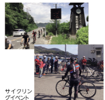
サイクリングイベント

「せとうちPEDAL Life」は2018年度に設定された福山初のサイクリングロード「しまち海道」を多くのの人に知ってもらいたい、福山に自転車文化を根付かせたいと、さまざまな活動を展開しています。 昨年7月と11月にはしまち海道を舞台にサイクリングイベントを開催しました。自転車での走行と併せて、沿線上の地域の特色を生かした食事やヨガなどのアクティビティが体験でき、参加者にも大変好評でした。 今年29日におまち海道で開催される「福ふくRide」にも参加し、サイクリング風景を撮影した広報動画を制作することで、ルートへのさらなる周知をめざします。