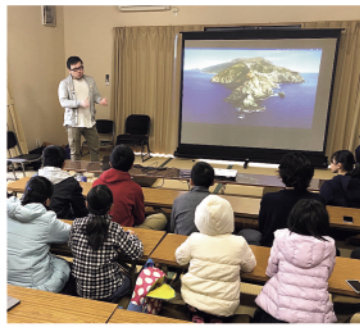
子ども映像制作ワークショップ

子どもたちが将来「おとなになったときに帰ってきたい」と思える田尻町をつくりたいと、地域の魅力にふれるイベントを企画・運営する「田尻の未来を考える会」。 昨年9月にはキャンペーンイベント、11月には「せとうちPEDAL Life」とコラボしたサイクリングイベント、12月には子どもが自分で映像制作をするワークショップなど幅広い体験行事を実施しています。 どの行事も田尻町の地域の良さを体感できる内容で、参加した子どもたちの地域への愛着を育んでいます。 またこれらの活動情報をウェブサイトで広く発信し、田尻町の魅力を町内外に伝えています。