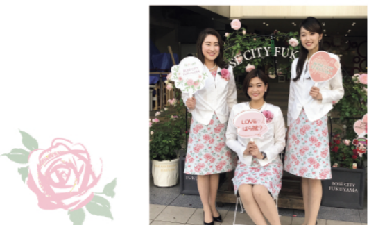
ローズコンシェルジュ

「ローズシティ福山」は「ばらのまち福山」の魅力発信やこれからのばらのまちづくりを担う人材育成を目的に活動しています。 現在は地域花壇などの維持管理を担う「ローズサポーター」や「ばらのまち福山」の魅力を伝え、案内役が担える人材として「ローズコンシェルジュ」を育成しています。 昨年10月には「ローズコンシェルジュとめぐる 秋の福山ばらめぐりツアー」を開催。ローズコンシェルジュたちがばら花壇を案内し、ばらのまち福山をPRしました。