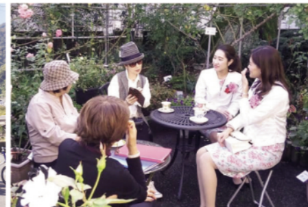
(一社)ローズシティ福山 ローズコンシェルジュとめぐる秋の福山ばらめぐりツアー