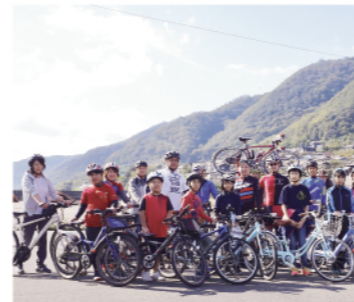
(一社)せとうちPEDAL Life × 田尻の未来を考える会 2団体のコラボによるサイクリングイベント