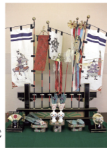
1950年頃の武者のぼり

963-2361 春季企画展「端午の節句展」 時5/17(日)まで 内幕末から現代までの武者人形・かぶと飾り・座敷のぼりなどを展示 ¥無料 ID175624