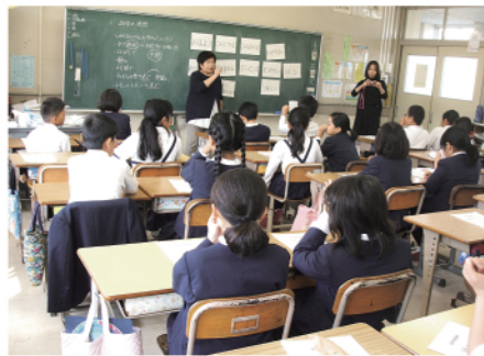
川口小学校での出前講座

る人もいますが、手話だけでは伝わりづらい方もいます。出前講座の受講者からは「伝え方にはいろいろな方法があることを知った」「聴覚障がい者が困っていることなどを少し理解できた」という感想をもらいます。学んだ手話を少しでも使ってもらえると、私たちも地域の中で、聞こえる皆さんと共生することができると思います。 ●聞こえる講師も元々美さん 条例制定後、手話を知ってもらう機会が少しずつ増えてきました。手話は聞こえない人たちの歴史とともに育まれてきた大切な言語です。手の動きだけではなく、表情や口、目を見て交わす言語です。手話の学習を通して意思を伝え合い、心を交わす大切さを知ってもらいたいです。また聞こえないという障がいを持つ