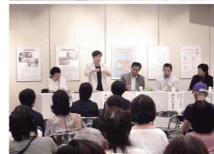
企画展のパネルディスカッション