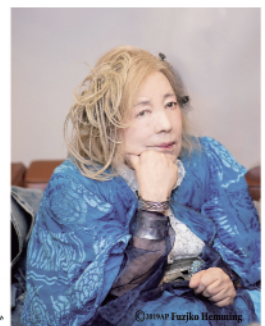
フジコ・ヘミング

☎928-1800 フジコ・ヘミング&広島交響楽団 時6/3(水)19:00~ ¥S席1万2,000円、A席1万円、B席8,000 円※未就学児入場不可。チケット発売中 ID175941