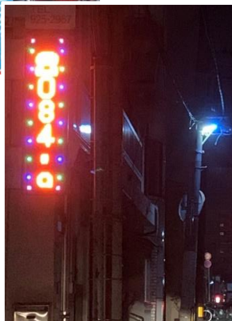
《点滅式発光の事例》