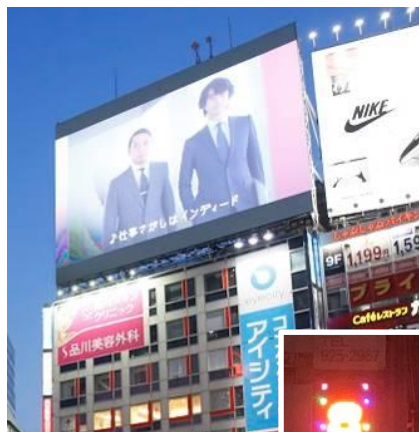
《可変表示式広告物の事例》