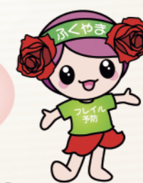
フレイル予防イメージキャラクター「フレイル予防ローラ」