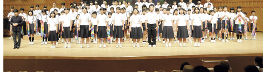
[2019市民平和のつどい、第65回市民平和大会] オープニング