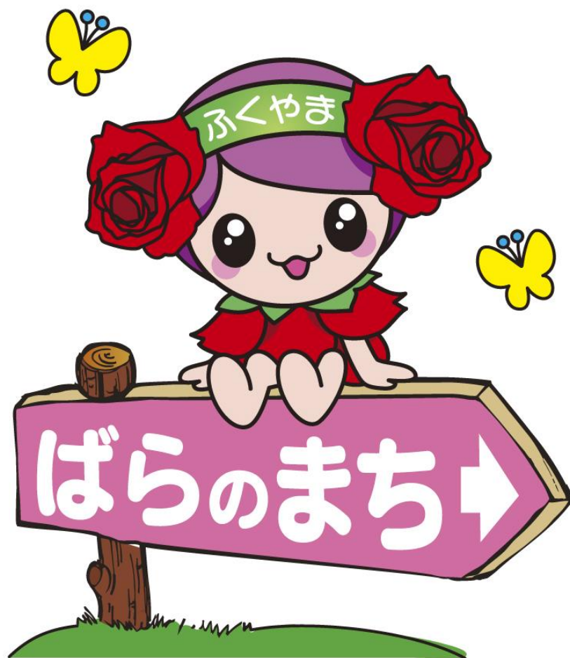
ばらのまち福山 イメージキャラクター「ローラ」