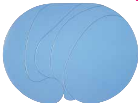
高橋秀《ブルーボール#101》1971年