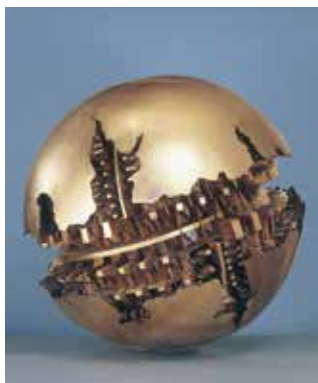
アルナルド・ボモドロ《球体》1982年