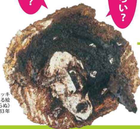
エンツォ・クッキ 《風景から大いなる絵 を引剥さねばならぬ》 1983年