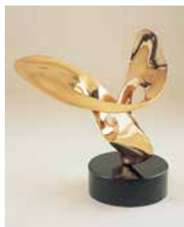
野田正明《可能性》2005年