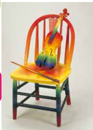
譚囁《Violin on the chair》1967年