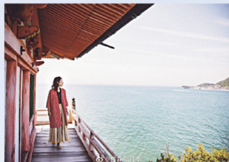
中国の人気インフルエンサーによるSNSを活用した福山の魅力発信