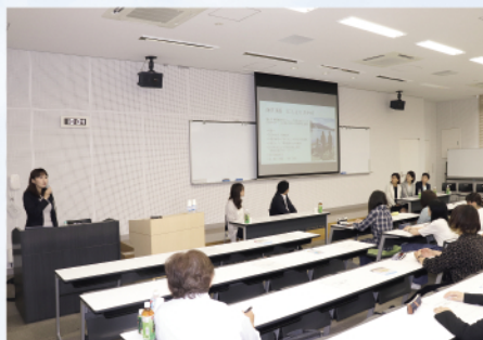
大学生を対象としたキャリアデザイン×ライフデザイン講座