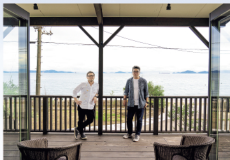
仕事(ワーク)と休暇(バケーション)の両立を楽しむ「ワーケーション」の推進