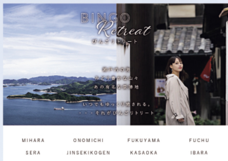
日常生活のストレスから離れ心身をリセットする「リトリート」の提案(写真は「びんごリトリート」)