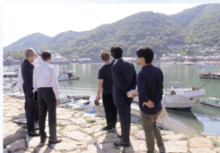
映像業界のトップクリエイターを招いて福山のロケ地としての魅力を分析