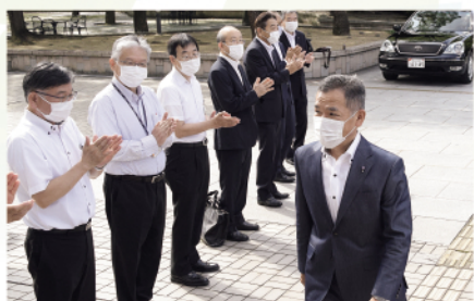
8月11日、職員に拍手で迎えられる中、市長再選に伴う初登庁をしました

この度、福山市長として2期目の重責を担わせていただくことになりました。 私は2016年の市長就任以来、ふるさと福山が備後地域の拠点にふさわしい、活力と魅力に満ちた輝く都市となるよう、市民の皆さまの声に耳を傾けながら「5つの挑戦」に一心に取り組んできました。 福山駅周辺の再生や福山北産業団地第2期事業の再開、抜本的な浸水対策といった都市基盤の強化に努めてきました。また、未来を担う子どもたちのための空調設備やICTなどの教育環境の整備、鞆の浦や福山城、ばらのまち福山国際音楽祭をはじめとする歴史・文化資源の磨き上げ、そして世界バラ会議の誘致など、新たな都市活力の創造にも力