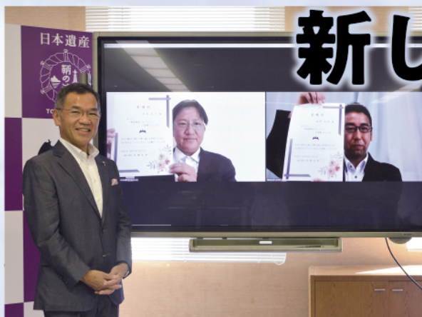
ウェブ委嘱式(8月17日)の風景

戦略推進マネージャーは、民間企業の最前線で活躍しながら、人口減少など本市が抱えるさまざまな課題の解決に、一緒にチャレンジする人です。本市では2018年3月に地方自治体として初めて兼業・副業で人材を受け入れており、その新しい働き方に注目が集まっています。