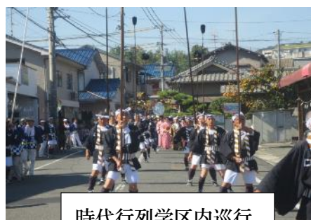
時代行列学区内巡行