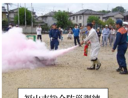
福山市総合防災訓練