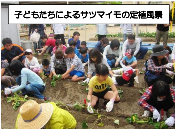
子どもたちによるサツマイモの定植風景

深津学区の放課後子ども教室は、子どもた ちに野菜の栽培を通じて、「食」のすばらし さ（楽しさ）を体験してもらっています。