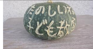
傷を入れて作った文字入りかぼちゃ

深津学区の放課後子ども教室は、子どもた ちに野菜の栽培を通じて、「食」のすばらし さ（楽しさ）を体験してもらっています。