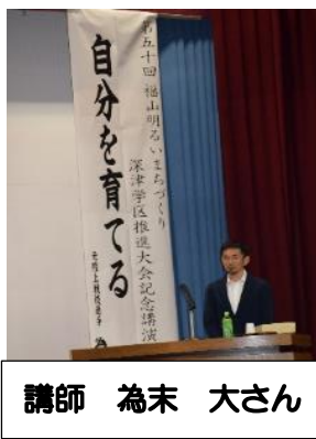
講師 為末 大さん

深津学区明るいまち づくり協議会主催の 推進大会が 50 回を 迎え、記念講演会を 開催しました。 演題「自分を育てる」 2019年10月12日