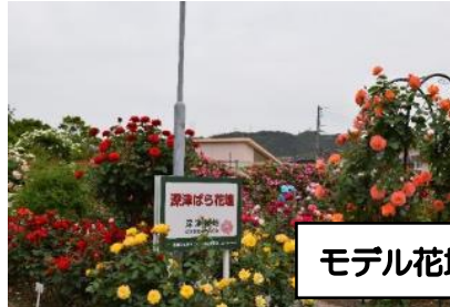
モデル花壇の深津ばら花壇