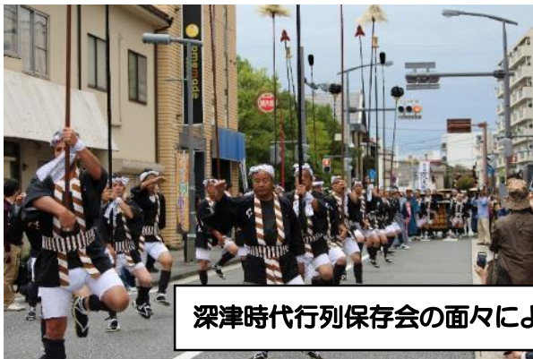
深津時代行列保存会の面々による「ひんよ踊り」

深津時代行列は、福山市内で唯一深津学区 だけの行事です。福山を開いた水野勝成公 の文化を継承しています