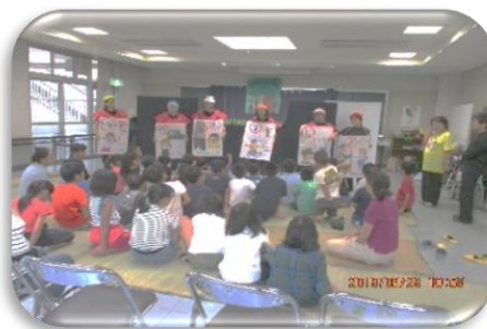
ペープサート（紙人形劇）