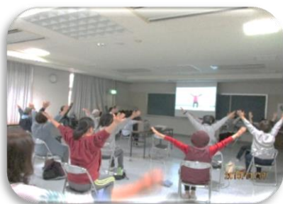
健康セミナー（いきいき百歳体操）