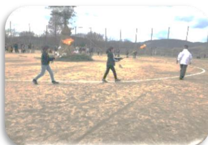
とんど・もちつき大会