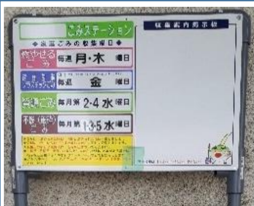
明王台オリジナル看板台