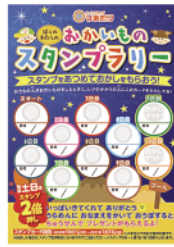
スタンプカードは各店舗で配布中 ※なくなり次第終了