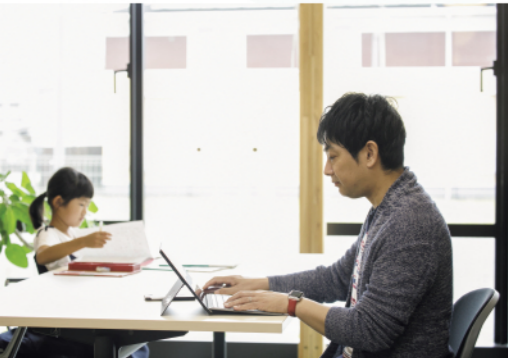
子どもを見守りながらの在宅勤務

ることもあります。普段から家事・育児への参加を心掛けていますが、在宅勤務中は通勤時間がなくなった分、いつも以上に取り組むことができました。娘と一緒に食事の準備ができたことは楽しかったですね。また勉強を見たり、一緒に公園で遊んだり、子どもたちと過ごす時間が増え、成長を感じる機会にもなりました。