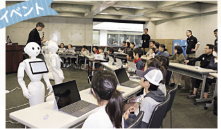
協力:ソフトバンク(株)、瀬戸内ファクトリービュー実行委員会