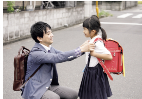
朝の見送りで子どもも笑顔

ら家族と過ごす時間をたくさんもてばいいですね。コロナ禍の中「一緒にいてくれてうれしい」と言ってくれる家族の言葉は本当に励みになります。私と妻がお互い協力することで、仕事も頑張りつつ、家族みんなと一緒に過ごせる時間を増やすことができたいと思います。