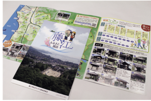
地域マップ 「藤江ふるさと探訪」