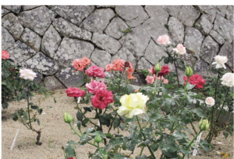
整備した花壇で成長するばら

整備のきっかけとなったのは平成30年7月豪雨。本郷川河川敷にあったばら花壇が水没し、