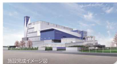
施設完成イメージ図