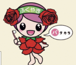
フレイル予防イメージキャラクター「フレイル予防ローラ」