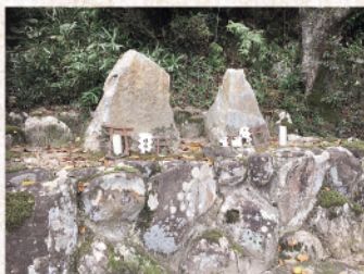
赤坂町と神村町境の塞神

水呑町と田尻町の境となる峠に、塞神の小社が祀られています。軻から福山に魚を運ぶため、重い荷