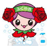
ばらのまち福山イメージキャラクター「ローラ」