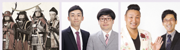
ロクモンジャー 天津 藩飛礼