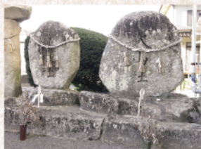
芦田町東之面の大山社(右側)

日本では、牛の形象埴輪が存在する古墳時代頃から牛の飼育が始まったと考えられ、草戸千軒町遺跡からも牛の骨が出土しています。江戸時代には農具の発明や改良が進み、牛を使用することで能率の良い農耕ができるようになると、急速に牛の飼育が増加し、重要な労働力および財産として家族同様に大切にされてきました。