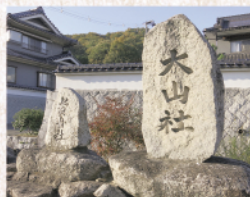
加茂町猪ノ子の大山社(右側)

生活に定着してくると、牛の需要は一段と増し、明治末から大正、昭和初期には農家に1頭、中には2・3頭飼育する家もありました。また牛の糞は堆肥として使用され、米や麦、桑などの収穫量も増加しました。このように田畑の耕作の主役である牛の霊を祀るとともに、牛の安産や増殖を祈願して大山社が祀られてきました。戦後、時代の変化により農耕も機械化され大山信仰は薄らいできましたが、場所によっては今年も年1回のお菓子の振る舞いなどの祭りが継承されています。